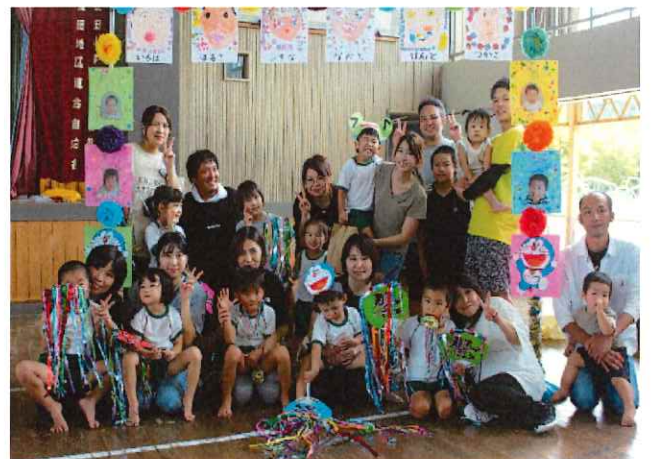
ご声援ありがとうございました。